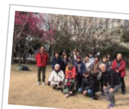
幕張海浜公園で 全員集合♪

毎週水・土曜日 午前9時 コア中庭に集合。 花見川・幕張の浜・幕張海浜公園周辺を60分ほど歩く。その後、海浜幕張駅前のプレナでお茶&オシャベリ。午前中には終了します。