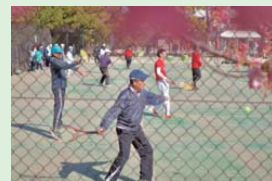
春は桜色に染まるコート

毎月、第一土曜日の午前中の初中級者向けの球出し練習会。新たに若葉地区の皆さんも受け入れられるように枠の拡大見直しをすすめます。