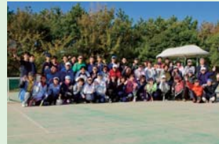
試合前の全員集合♪

5月の男子ダブルス、女子ダブルス大会、11月のミックスダブルス大会。家族やお友だちの熱い応援もうけながら、楽しみました。