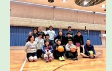
熱戦を終えて笑顔の一枚