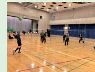
熱い中にも和気あいの仲間です