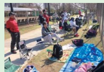
観戦をするコート周り