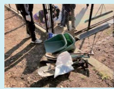
清掃道具も用意しています