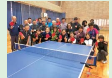
熱戦終えて笑顔の全員集合♪

卓球が人気スポーツになる中、美浜打瀬小に愛好者たちが集まりました。互いの技をだしあいラリーを繰り広げました。