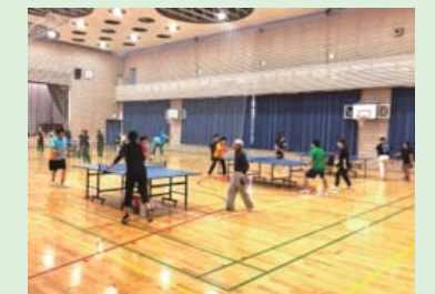
ダブルス戦。どの台も熱い!