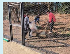
打瀬中テニス部のみんなも