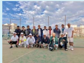
熱戦終えて笑顔の集合写真

合わせて百歳を超えるペア同士。動きも軽やかに一日いっぱいボール打ちあい、試合に汗を流しました。