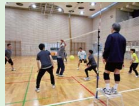
汗いっぱいの好ゲーム