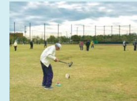
力いっぱいスイング

春と秋の2回。3丁目公園(スポーツ広場)に広くコースをつくり、1日ボール打ちゲームを楽しみました。