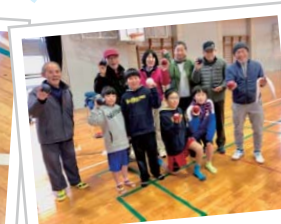
楽しく体験しました♪