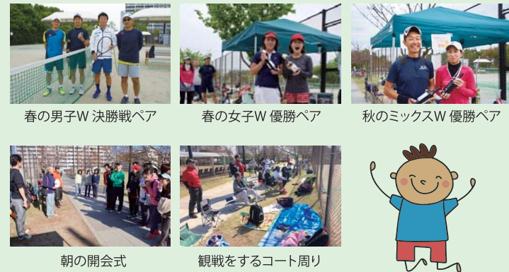
春の男子W 決勝戦ペア