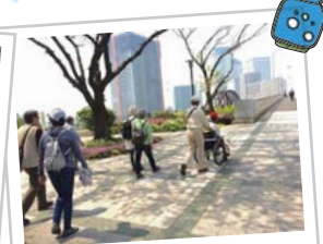
豊洲界限をイベントウォーク 春海橋の手前あたり。