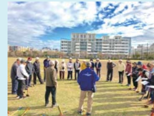
快晴のもとで開会式