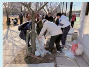
テニス連合会の役員さんが中心