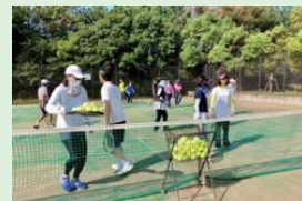
ボール拾いながら会話楽しむ